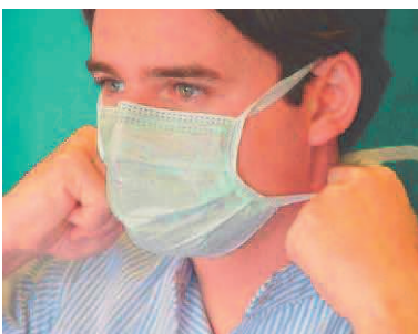
7. ohne Berührung der Maske durch seitlichen Zug die unteren Haltebänder zerreißen