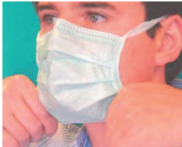
5. Maske über das Kinn zum Hals hin entfalten