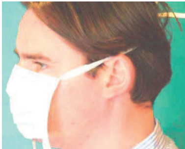
4. richtiger Sitz der oberen Haltebänder