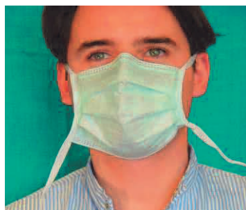
8. ohne Berührung der Maske oberes Halteband seitlich zerreißen und kontaminationsfrei entsorgen