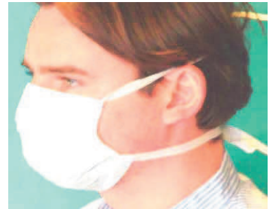
6. untere Haltebänder im Nacken verknoten